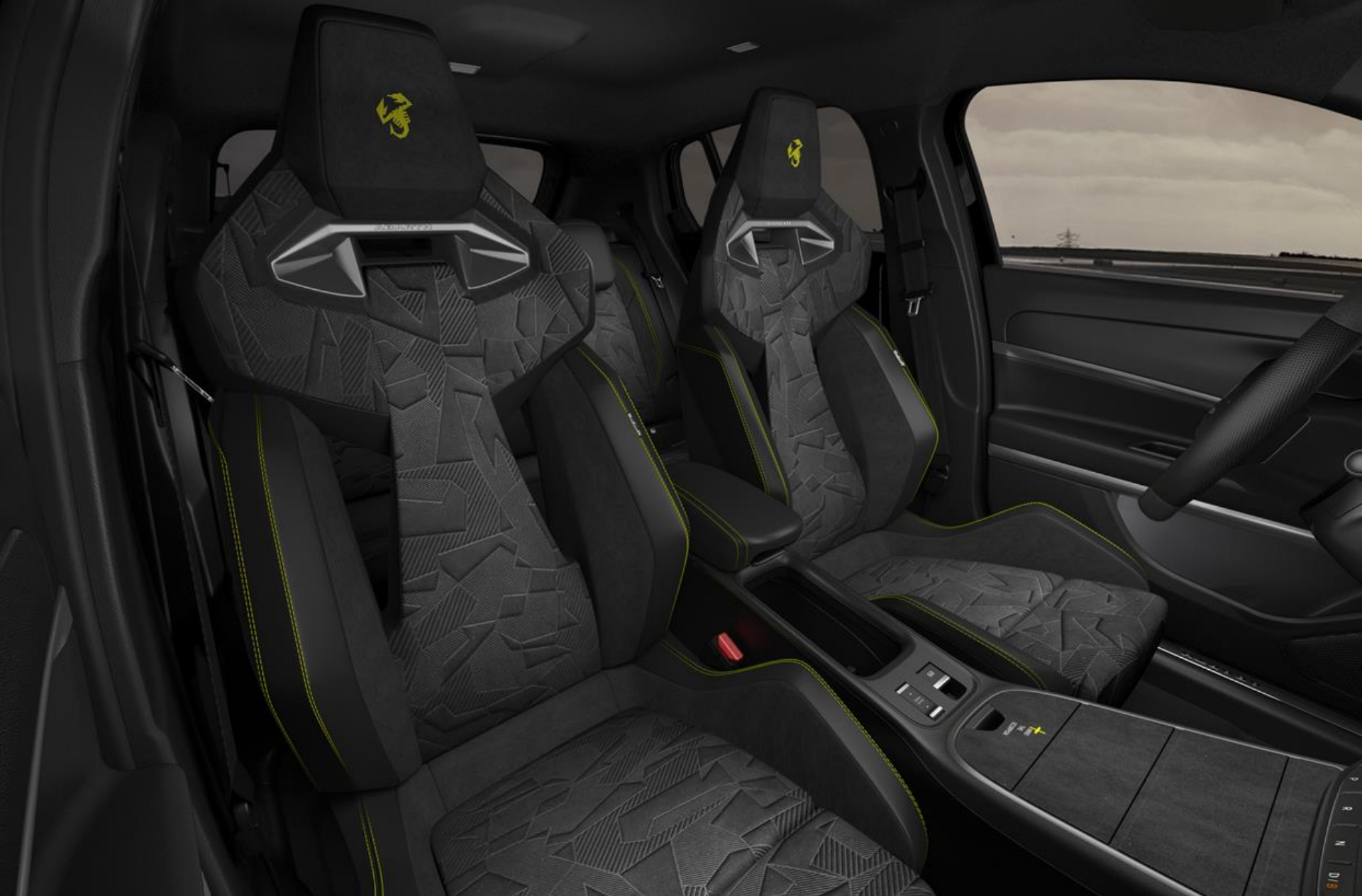
SCORPIONISSIMA | INTERIEUR